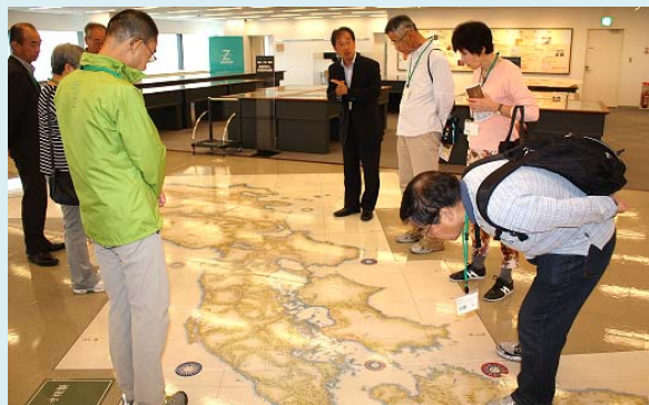
伊能忠敬編纂による「大日本沿海輿地全図 (原寸複製)」を熱心に鑑賞