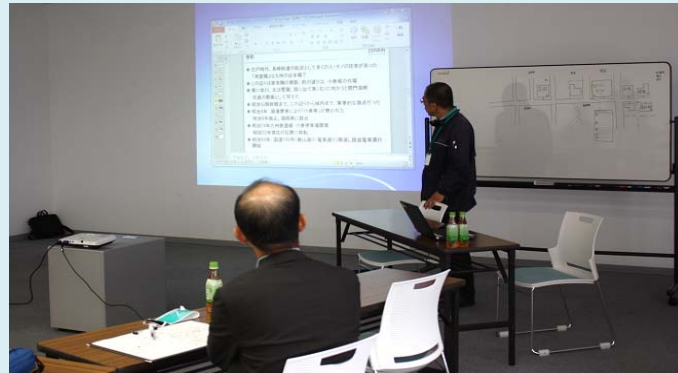
調査担当者から、調査場所の変遷、調査の方法などについての説明