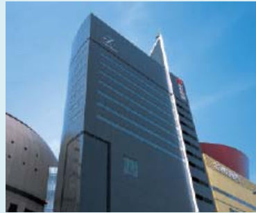
本店所在地でもあり「地図の資料館」もある リバーウォーク北九州に集合