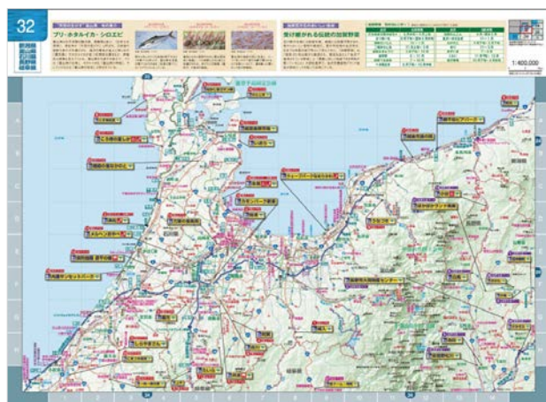
道の駅めぐりに最適なロードマップ

俯瞰性の高い1/400,000の縮尺の全国ロードマップを収録。また、巻末には1,040ヶ所すべての道の駅を網羅した一覧「道の駅一覧」を掲載しています。巻頭特集の他にも旬の食材を取り扱う道の駅は全国に多くあります。おいしい食材を求めて道の駅をめぐる旅にご活用いただけます。