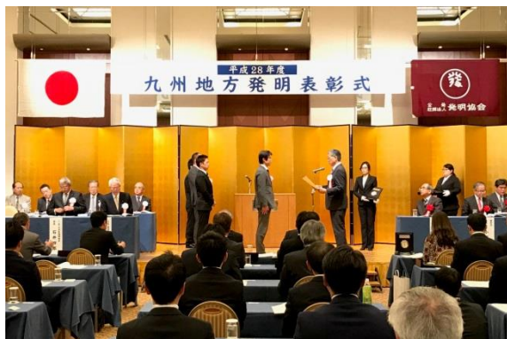
11月18日大分オアシスタワーホテルで行われた表彰式

ゼンリンでは今後もより一層、人々の生活に貢献する技術開発に、積極的に取り組んでいきます。