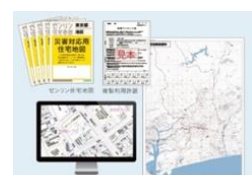
提供する備蓄用地図の一例

ゼンリンは全国 600 超の自治体と「災害時支援協定」を締結しています。備蓄として住宅地図帳や広域図を提供することで災害発生時の迅速な初動対応に繋げ、地域の防災・減災を支援しています。