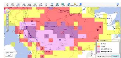
機能の一例(イメージ)

LGWAN 環境下で利用できる住宅地図アプリケーションです。豊富な機能を兼ね備えており、業務用途に合ったコンテンツを組み合わせ利用できます。危機管理部署で必要な機能をパッケージ化した「防災パック」を提供。