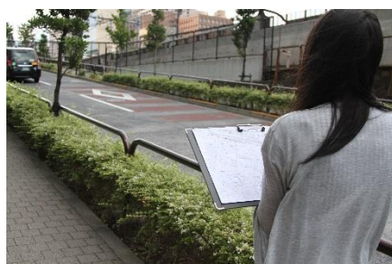
まち歩きで避難時に危険な箇所を確認