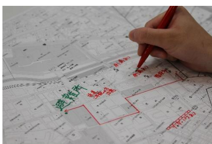
地図に避難所、危険箇所を記入している様子※イメージ