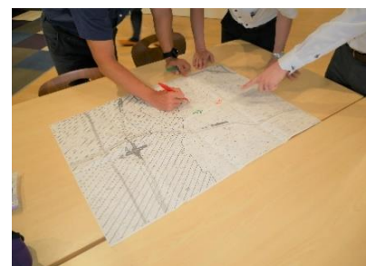
まち歩きで調べたものを自治会や家庭で共有