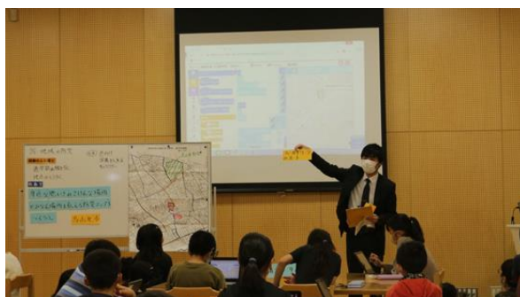
▲4 年生の総合的な学習の時間「地域の防災」で「まなっぷ」を利用(世田谷区立烏山北小学校)

https://www.zenrin.co.jp/product/casestudy/example/karasuyamakita_manap/index.html