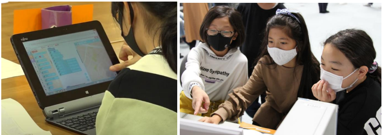
▲「まなっぷ」を授業で使用している様子

■「まなっぷ」の商品サイト: https://www.zenrin.co.jp/product/category/education/manap/es/index.html