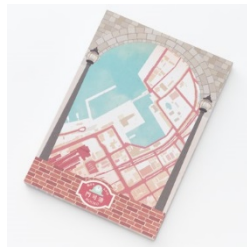
【街まち】A6 メモパッド /レトロ 門司港