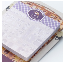
【街まち】ふせん /レトロ 名古屋