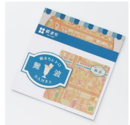
【街まち】ステッカー(2枚) /レトロ 難波