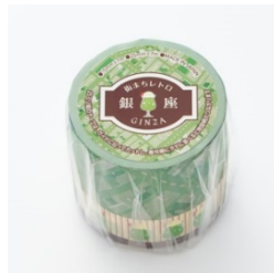
【街まち】マスキングテープ (2本)/レトロ 銀座