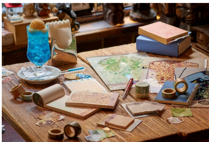
「街まちレトロ」ステーショナリー キービジュアル