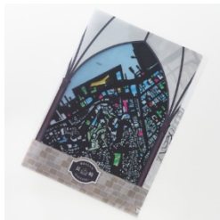
【街まち】2 ポケット ファイル/レトロ 長崎