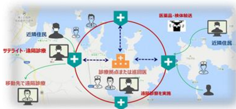
オンライン診療・服薬指導、ドローン配送 実証実験イメージ図