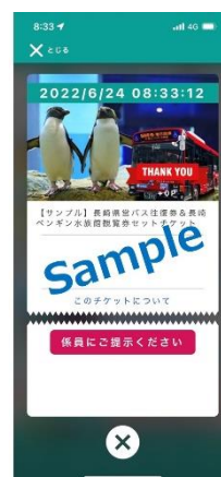
購入後は係員に電子チケットの画面を提示ください