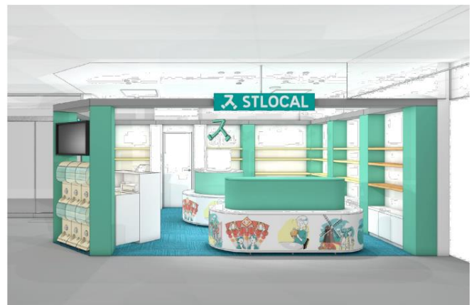
▲ショップ「STLOCAL」外観(長崎駅前店イメージ)