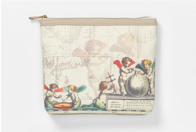
▲ポーチ ¥2,200(全 1 柄) メイク用品や充電器など、小物類をまとめて収納可能。 型崩れしにくい合成皮革素材。