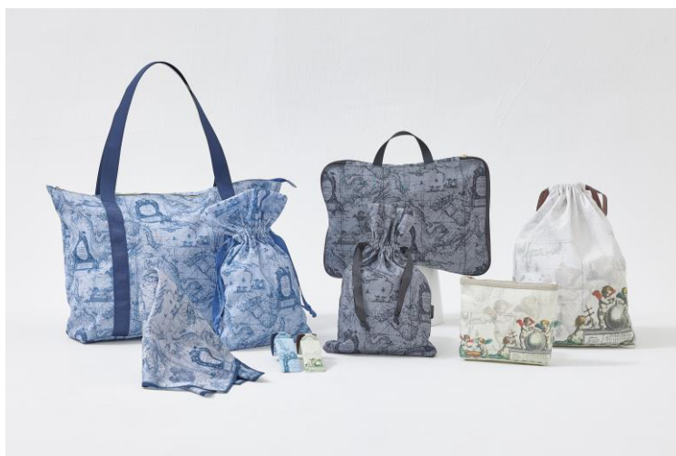
▲古ちず Angel Amulet series

株式会社ゼンリン(本社:福岡県北九州市、代表取締役社長:高山善司、以下ゼンリン)は、地図がデザインされた文具・雑貨を販売する「Map Design GALLERY」より、これからの旅行シーズンにぴったりのトラベルアイテム「古ちず Angel Amulet series」を、Map Design GALLERYオンラインストアおよび各店舗にて2024年2月19日(月)より販売開始します。