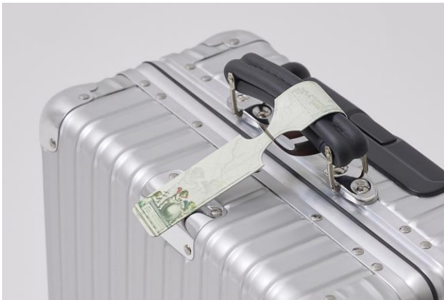
▲ラゲッジタグ ¥1,650(全 2 柄) 自身の荷物を識別しやすくするために、キャリーケースの持ち手 に取り付けて使用。中のカードには、名前と住所の記載が可能。