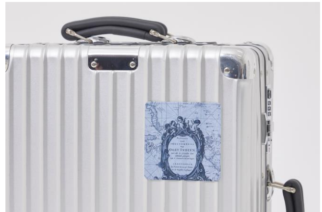
▲ステッカー ¥880(全 3 柄) 目印としてキャリーケースに貼っても存在感のある、 10cm×10cm のサイズ。雨に強い防水素材。