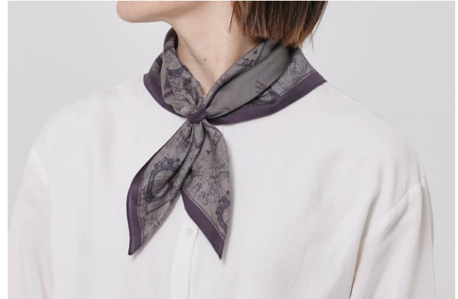
▲大判ハンカチ ¥1,980(全 3 柄) サテン調の上品なハンカチ。旅先では目隠しとして荷物の上 にかけたり、首元を華やかにしたりするスカーフとしても。