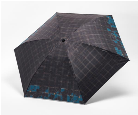
▲晴雨兼用折りたたみ傘

株式会社ゼンリン(本社:福岡県北九州市、代表取締役社長:高山善司、以下ゼンリン)は、地図がデザインされた文具や雑貨を販売する当社ブランド「Map Design GALLERY」の新商品として、夏のお出かけシーズンにぴったりの新アイテムを、Map Design GALLERYオンラインストアおよび各店舗にて販売開始します。今回、新アイテムの中からメンズ向けデザインの「晴雨兼用折りたたみ傘」「2WAYトート&ショルダーバッグ」「衣類ポーチ」「3連ポーチ」を紹介합니다。