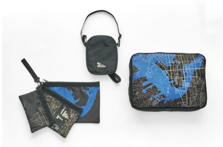
▲(左より)「3 連ポーチ」「2WAYトート&ショルダーバッグ」「衣類ポーチ」