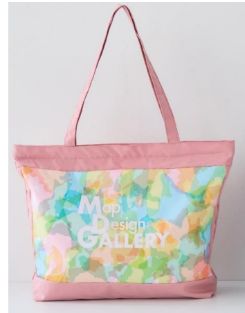
▲（左より）オリジナルバッグ ネイビー、ピンク イメージ