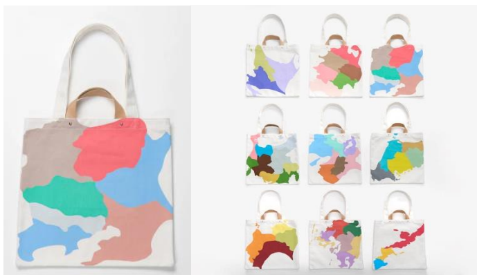
▲（左より）関東地方のデザインと全 9 エリアのデザイン イメージ オンラインストア及び店舗で購入可能

スクエアトートバッグは肩がけと手持ちの2way仕様で地図を大胆にデフォルメしたデザインです。北海道、東北、関東、中部、近畿、中国、四国、九州、沖縄の9つの地方からお選びいただけます。スクエアトートバッグを含む総額約¥11,000（税込）相当の地図柄アイテムが入っています。