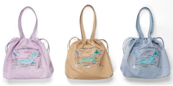
▲（左より）ドロースtringバッグの刺繍デザインと3色のデザイン イメージ オンラインストア及び店舗で購入可能 ※ページのみ店舗限定販売