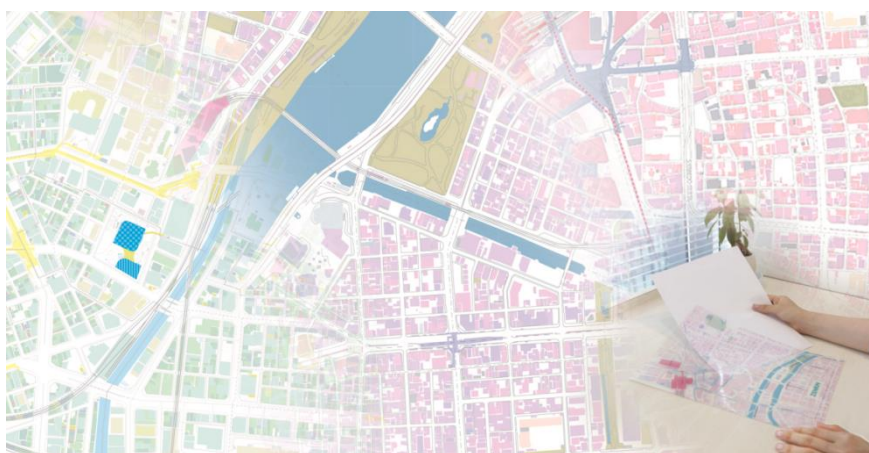
オリジナル地図柄グッズであなたの街を身近に

ゼンリンは、地図情報に彩りやストーリーを加えたデザイン性に富んだ地図を創造し、機能性だけでなく、使いたくなる・見せたいくなる、『新しい地図のかたち』を提供していきます。