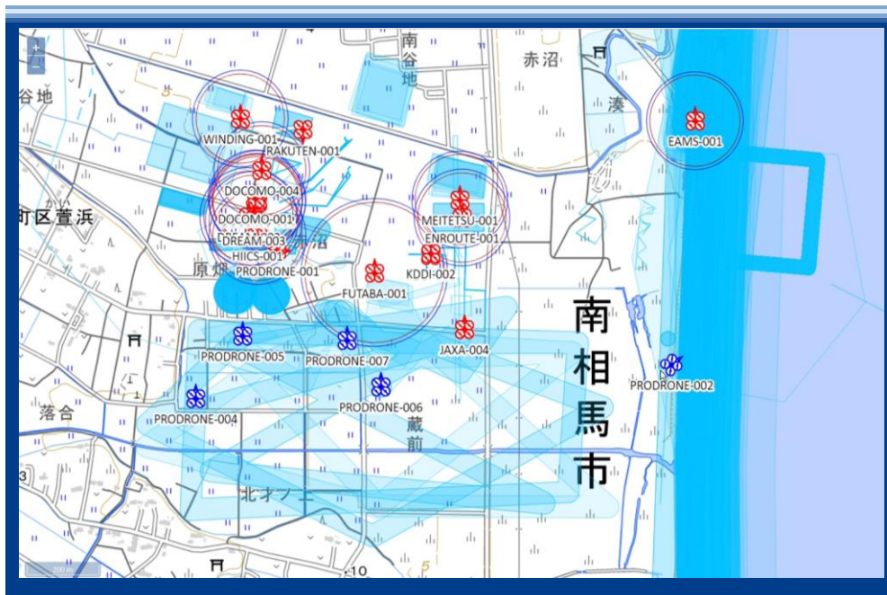
図4 飛行状況管理画面