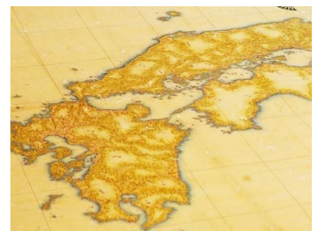
實測輿地圖 西日本部分