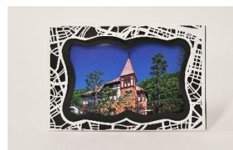
(左から)キーホルダー、しおり、マグネット、タンブラー、フォトフレーム