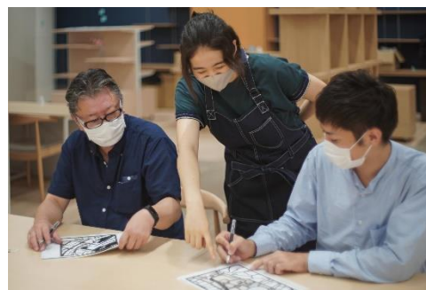
▲「地図工房」で「切り絵」の創作をしている様子

初めて創作される方でも、専門のスタッフが丁寧にサポートをさせていただきます。好きな“まち”を創作する楽しさや面白さを感じていただき、地図の奥深さを知っていただけるような場所を目指していきます。