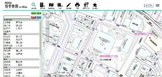
▲自治体専用 住宅地図 for Web

自治体向けのクラウド型住宅地図サービス。LGWAN環境にも対応しており、資料作成、問合せ対応、訪問準備などの自治体業務をサポートします。