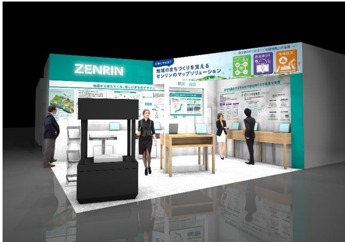
▲ゼンリンブース イメージ

本イベントにおいてゼンリンは、「地域のまちづくりを支えるゼンリンのマップソリューション～自治体DXに役立つ「地図情報」の活用～」をテーマに、Web上で最新の住宅地図データを利用できる自治体向けサービス「自治体専用 住宅地図 for Web」を初出展するほか、自治体、自治体向けサービスを提供する企業や地方創生・スマートシティ等に取り組む企業、及び教育現場に向けたソリューションについて紹介します。