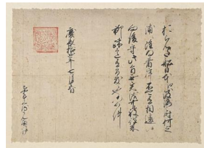
▲徳川家康朱印状(複製) 1609年 平戸市所蔵(原本:オランダ国立文書館)

1609年に徳川家康が発行した朱印状により、日本とオランダの貿易が始まりました。その朱印状の冒頭には「おらんだ」の表記があり、新たな貿易相手国に期待を寄せる日本の想いが込められた言葉として、平仮名表記のまま企画展のタイトルに用いました。