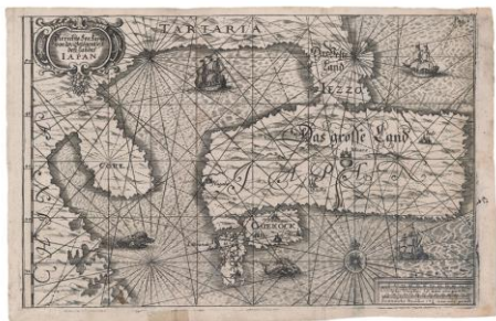
▲カロン『日本大王国志』所収 「日本図」1663年 ゼンリンミュージアム所蔵

当時、日本の北辺に関する情報は曖昧であった。本図は、本州北部の新たな知見を示した地図とみられている。