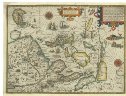
▲リンスホーテン「東アジア図」 1595-96年 ゼンリンミュージアム所蔵

本企画展では地図や資料など28点を展示し、オランダと日本の立場や思惑の違いに注目しながら、17世紀における日蘭関係の深化を紐解きます。