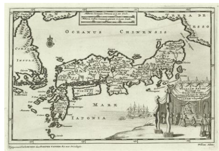
▲ファン・デル・アー 「日本図」1707年 ゼンリンミュージアム所蔵

鎖国体制下で西洋への唯一の玄関口となった出島。オランダ人がもたらした学問や技術は日本の近代化の一助となった。