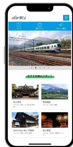
画面はイメージです

今回、「デジタル田園都市国家構想」の一環として、観光地までのルート案内から交通チケット購入案内など、デジタル技術を用いた観光型 MaaS 事業を展開し、“秩父観光をもっと楽しく！もっと便利に！” することで、旅ナカにおける秩父市・横瀬町の観光体験の向上、観光客のリピー率向上への寄与を目指し、事業を開始しました。