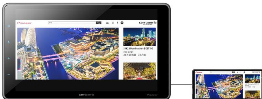
【カロッツェリア ディスプレイオーディオ「DMH-SF500」での WebLink Cast 使用イメージ】

「WebLink」のキャスト機能「WebLink Cast」を使用することで、接続したスマートフォンの画面を映し出すだけでなくディスプレイオーディオの画面上で操作が可能です。また、スマートフォンに保存されている音楽や動画ファイルにアクセスすることができます。