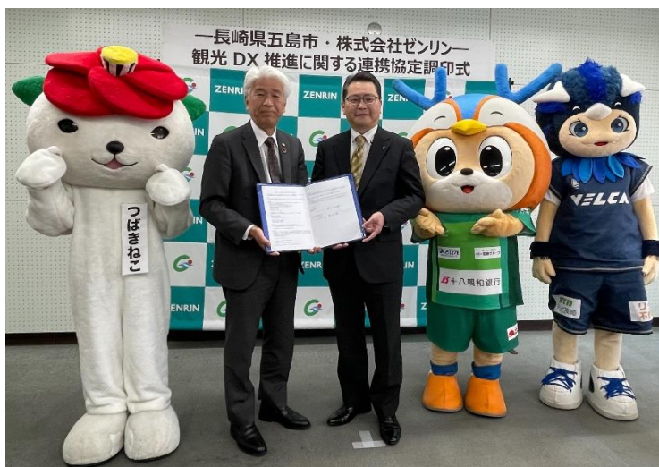
連携協定 調印式の様子

本協定により、ゼンリンが運営する観光情報Webサイト&スマートフォンアプリ「STLOCAL」の導入及び利活用による五島市の魅力発信や、観光周遊を促進する仕組みを構築し、地域活性化に寄与することを目指します。