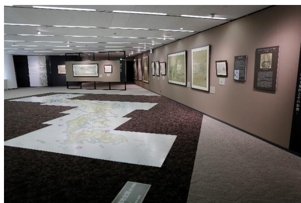
▲第2章 伊能図の出現と近代日本