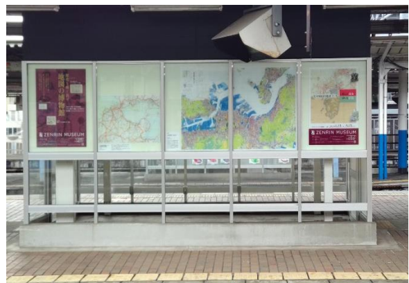
▲5・6番のりばの旧喫煙ルームを活用した展示スペース