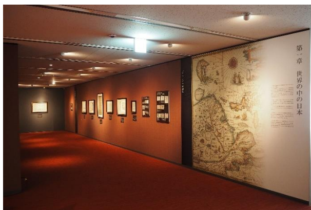
▲第1章 世界の中の日本