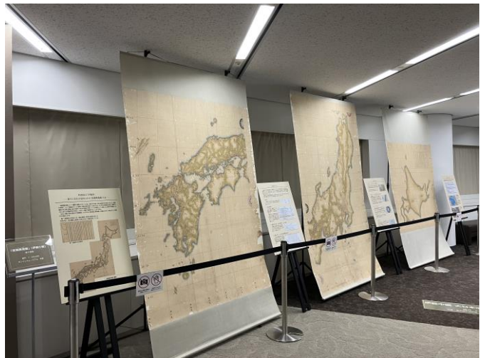
▲常設展示 第二章 実測輿地図の複製展示

第一(蝦夷地) 151.9 × 160.5 cm / 第二(東日本) 256.6 × 161.0 cm 第三(西日本) 203.7 × 160.0 cm