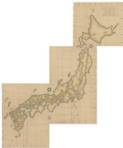
▲実測輿地図の3舗を接合したもの

第一(蝦夷地) 151.9 × 160.5 cm / 第二(東日本) 256.6 × 161.0 cm 第三(西日本) 203.7 × 160.0 cm