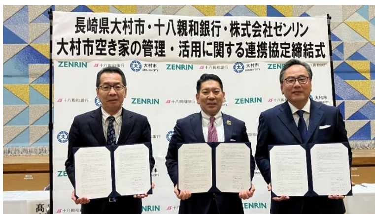
連携協定 締結式の様子

※「大村市空き家マッチングサービス」サービス紹介ページ： https://akiya.zenrin.co.jp/